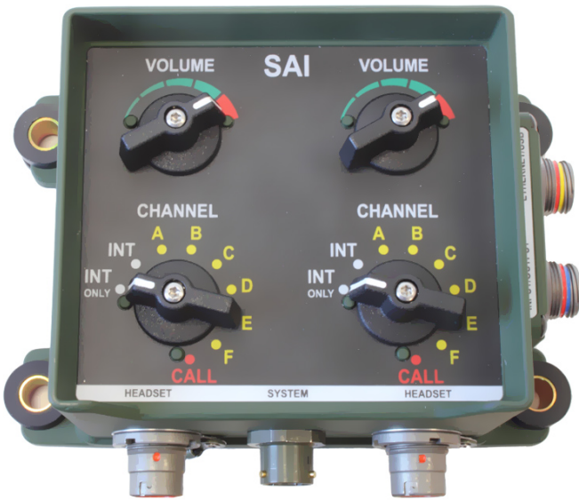
AT VICM 208- SAI– Интерфейсная система аварийной сигнализации высокого уровня

Температура хранения Условия окружающей среды